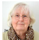
Gudrun Reiß Literatur-Café