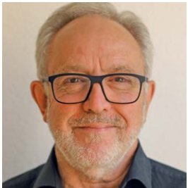
Roland Reiner Literatur, Geschichte Gesellschaft