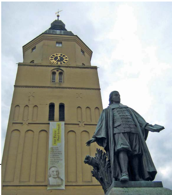
Foto: Paul-Gerhardt-Denkmal vor Lübbener Kirche

Online: offener Link zur Veranstaltung unter www.jungealte.info